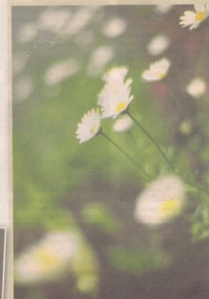
Et sommerbilde, «Melancholia», fra Karasjok. Mvh Tor Egil Rasmussen